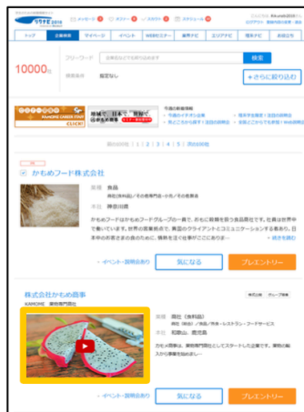
▲「リクナビキャスト」 リクナビ 企業検索結果一覧画面