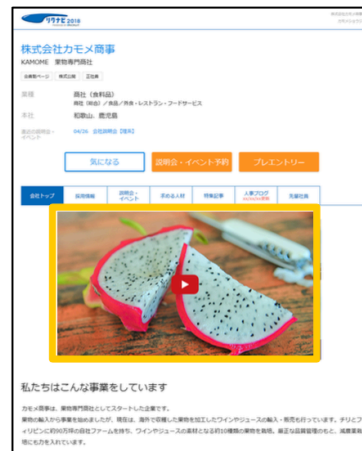
▲「リクナビキャスト」 リクナビ 企業トップ画面